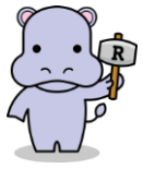
あんしんリフォーム工事瑕疵保険イメージキャラクター「あんしんするかはあ〜」